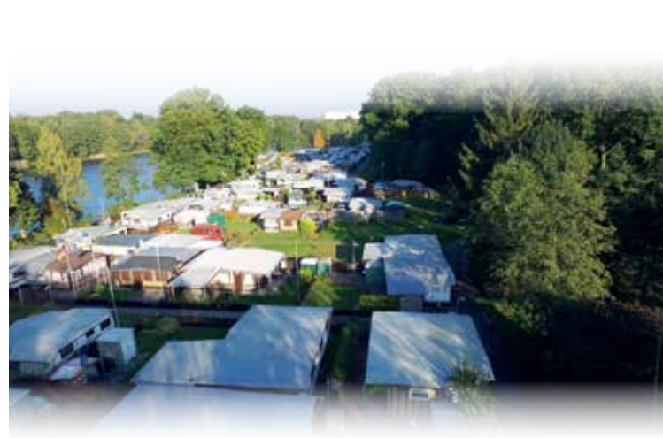
Erholung von seiner schönsten Seite